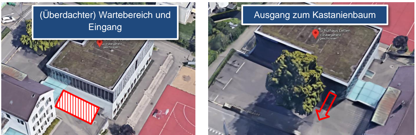
Abbildung 2: Definierter Wartebereich/Eingang und Ausgang im Schulhaus Letten.

Ein direkter Kontakt zwischen den verschiedenen Gruppen ist zu vermeiden. Aus diesem Grund wird der Trainingsstart jeder Riege um 5 Minuten nach hinten gelegt (auch wenn keine andere Riege des OTVG vorher in der Halle ist). Gleichzeitig werden die Leitenden das Trainings ebenfalls 5 Minuten früher beenden, um ein gestaffeltes Verlassen der Turnhallen und des Turngebäudes zu gewährleisten. Die Turngebäude sind nur über die in diesem Dokument definierten Ein- und Ausgänge zu betreten (siehe Abbildungen).