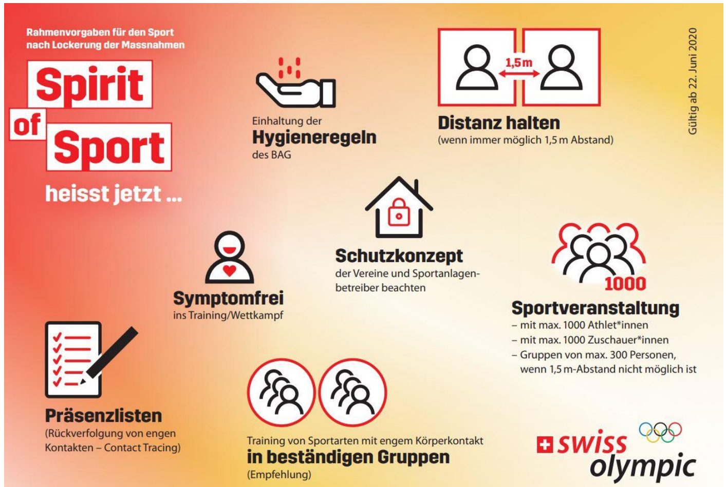
Abbildung 3: Plakat von Swiss Olympic.